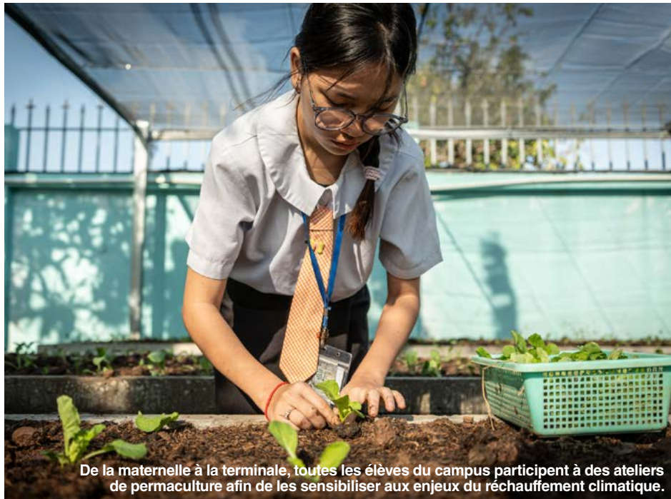
De la maternelle à la terminale, toutes les élèves du campus participent à des ateliers de permaculture afin de les sensibiliser aux enjeux du réchauffement climatique.